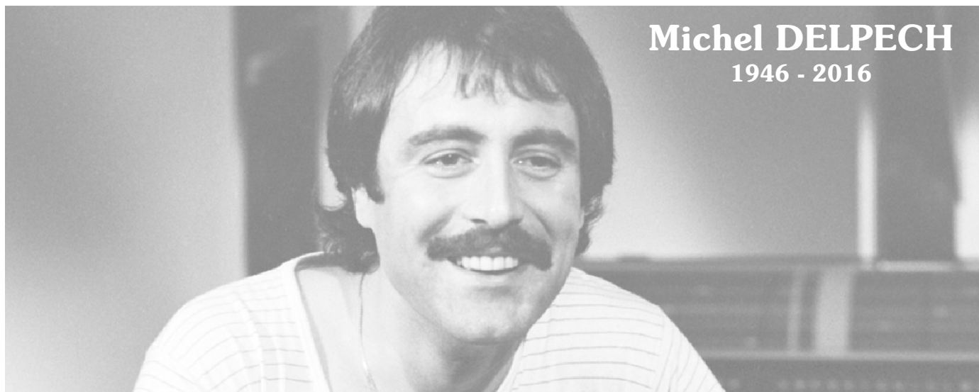
Michel DELPECH 1946 - 2016