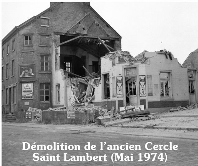
Démolition de l'ancien Cercle Saint Lambert (Mai 1974)

Eh oui, c'est en 1976 qu'ont eu lieu les premières fancy-fair et retrouvailles au Saint Lambert, remplaçant fièrement l'ancien Cercle